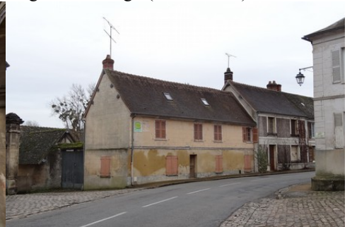
Une maison en pierre de taille