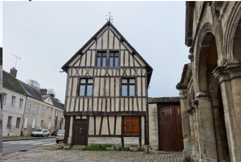
Une maison à pans de bois