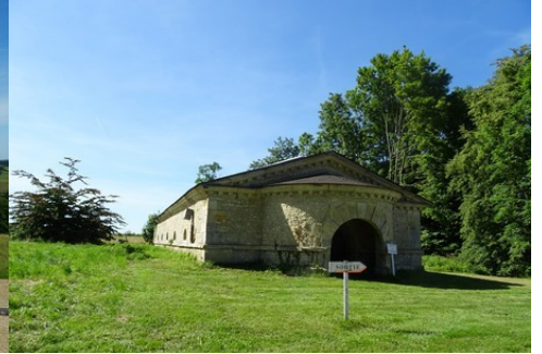
L'ancien château d'eau du XVIII e siècle