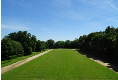
La perspective vers le Sud