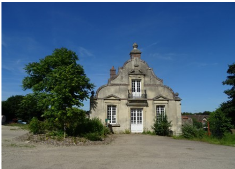
Un ancien commun voisin du château

Les avis seront cohérents avec ceux émis ces dernières années, à savoir : pas de maisons à volume compliqué (type V, W, Y, ou Z), pentes à 45° pour les volumes principaux, ardoise ou tuile plate de teinte brun vieilli, à 20u/m 2 , avec un débord de toiture de 20cm, enduit de teinte beige clair avec modénatures (au choix : chaînages, encadrement de fenêtres, soubassement, colombage...). *Voir les autres fiches.