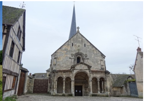
L'église de Dangu (classée MH)