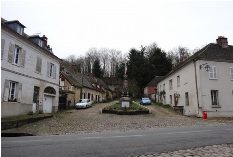
Quelques maisons dans les abords