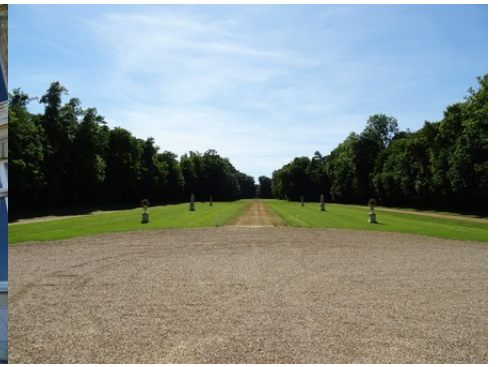
La perspective vers l'Ouest