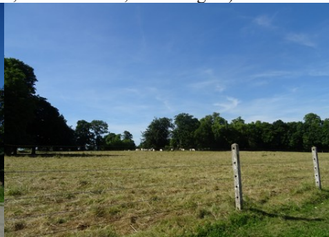
Une prairie aux alentours