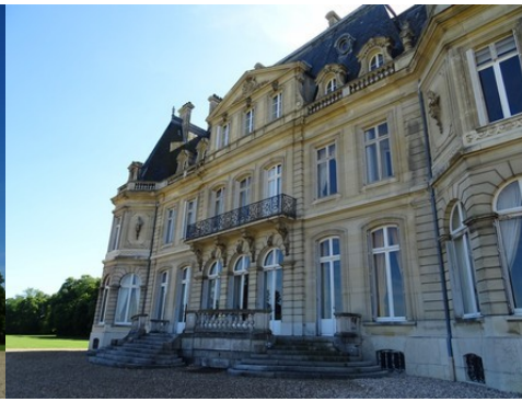
La façade est du château