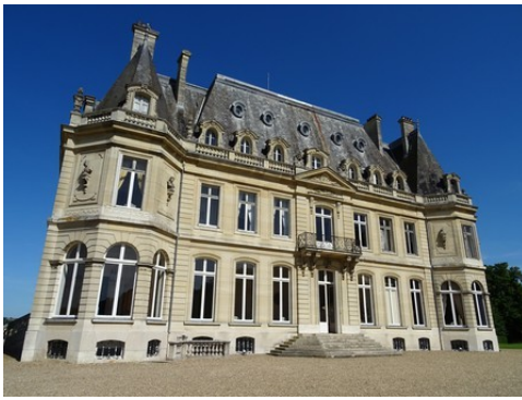
La façade ouest du château