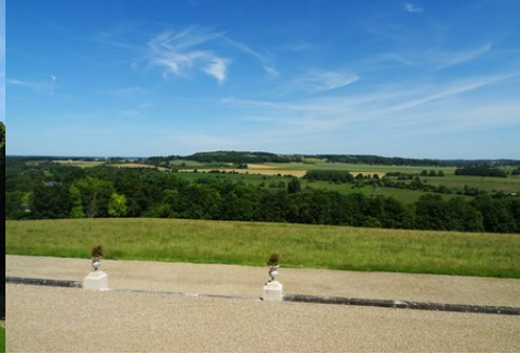
La vue lointaine vers l'Est